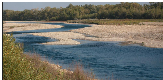
La Durance

La Durance constitue le plus long site Natura 2000 de PACA avec 230 kilomètres de cours d'eau, du barrage de Serre-Ponçon à sa confluence avec le Rhône. Grande rivière à la fois alpine et méditerranéenne, son fonctionnement a profondément évolué depuis quelques décennies (extractions de graviers, aménagement agro-industriel).