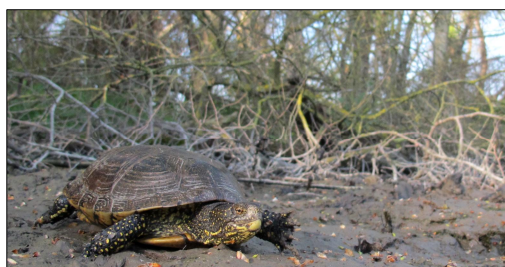
La Cistude d'Europe. *

Certaines espèces ont pu également s'adapter à l'activité humaine. Les chauves-souris, dont les effectifs mondiaux se sont effondrés depuis le milieu du 20ème siècle, apprécient les ouvrages d'arts (ponts...) pour se reproduire. Quand on sait qu'une seule d'entre elles mange jusqu'à 1000 moustiques par nuits, quelques chauves-souris dans son grenier constituent le meilleur insecticide naturel qui soit ! L'activité agricole extensive permet également de maintenir certaines espèces d'oiseaux emblématiques comme l'Outarde canepetière, qui, grâce à l'implication de certains agriculteurs, tend à retrouver une dynamique plus favorable.