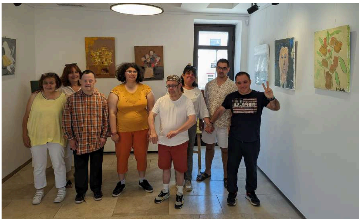
Exposition des résidants du Foyer de vie Louis Philibert - Juin 2024